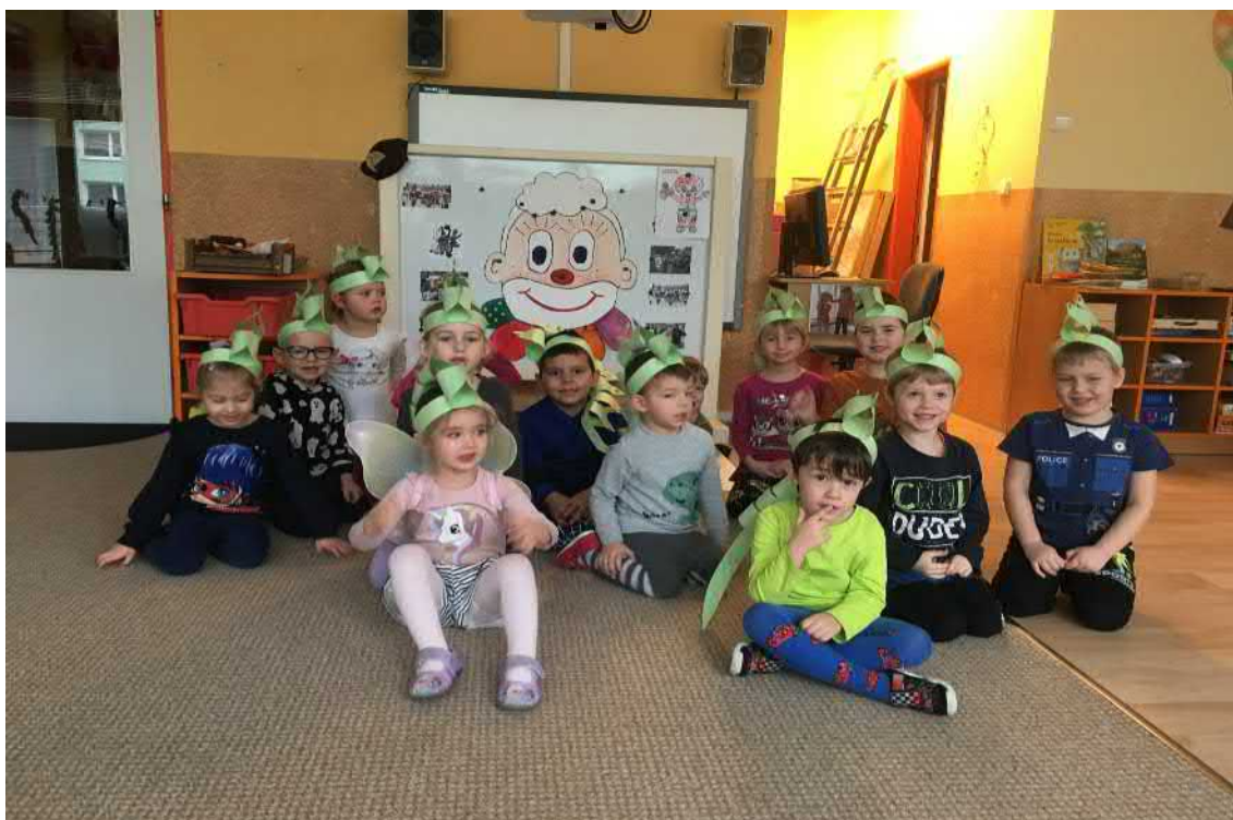
Dovádění v maskách