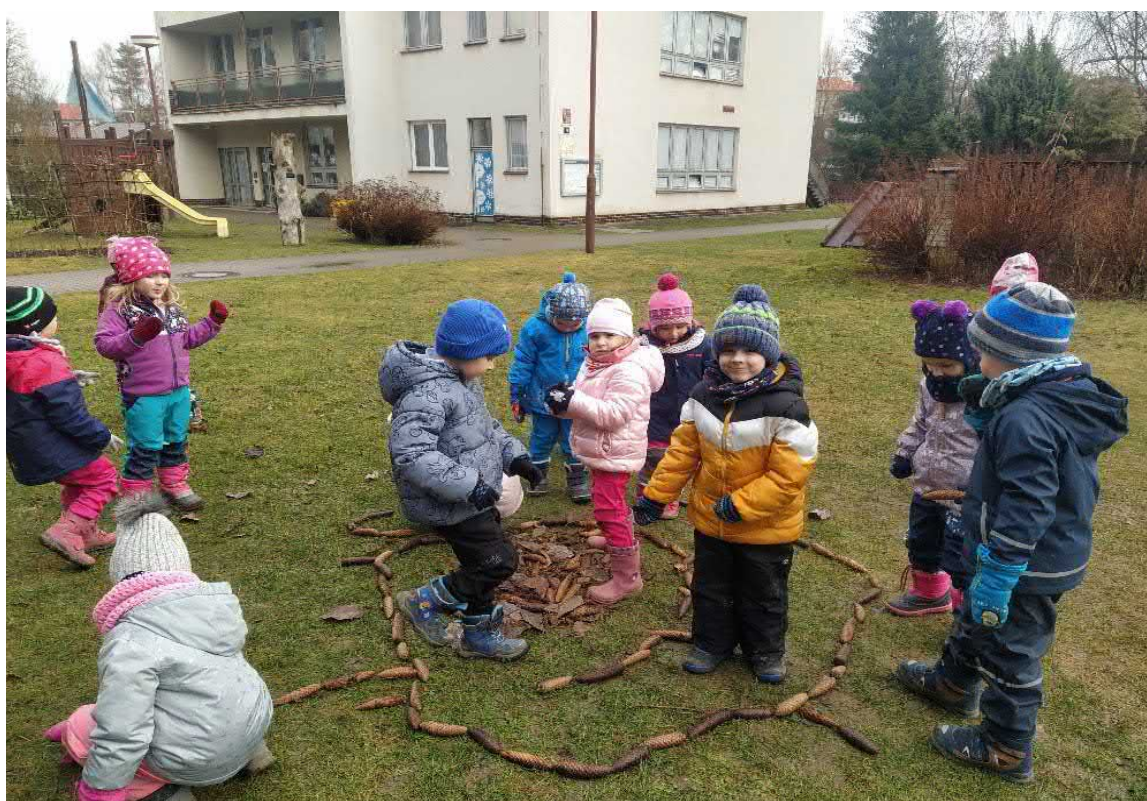
Hry na zahradě