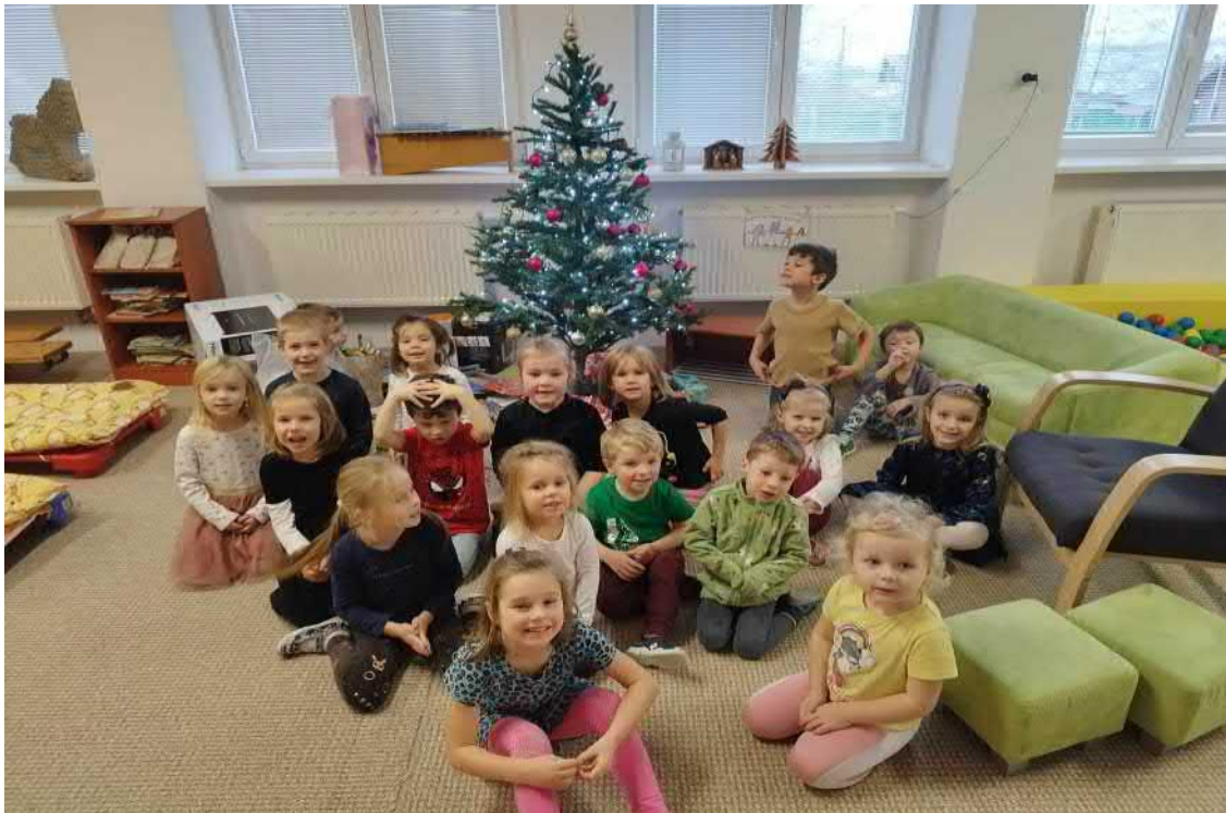
Vánoční čas ve školce