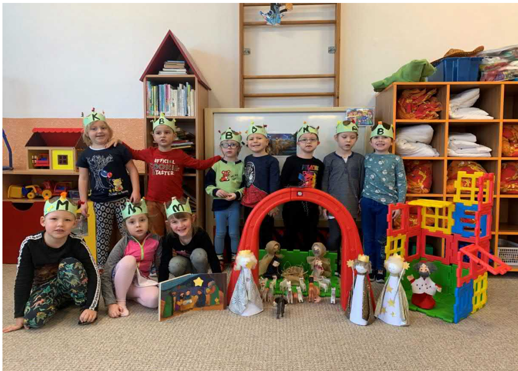
Tradice Tří králů