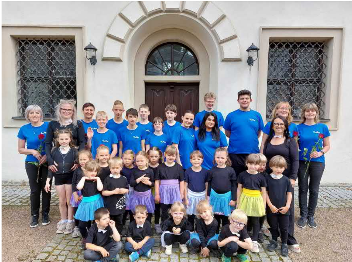
Společné vystoupení Džembíků a Berušek