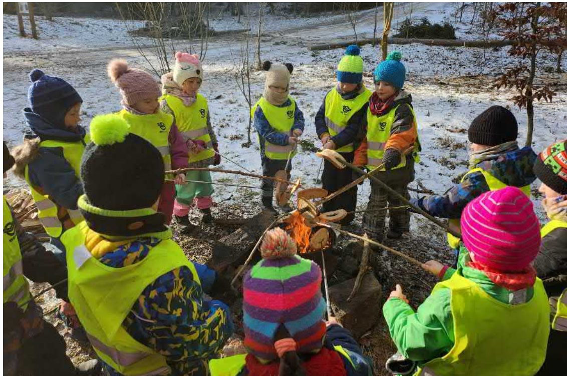
O dvanácti měsíčkách