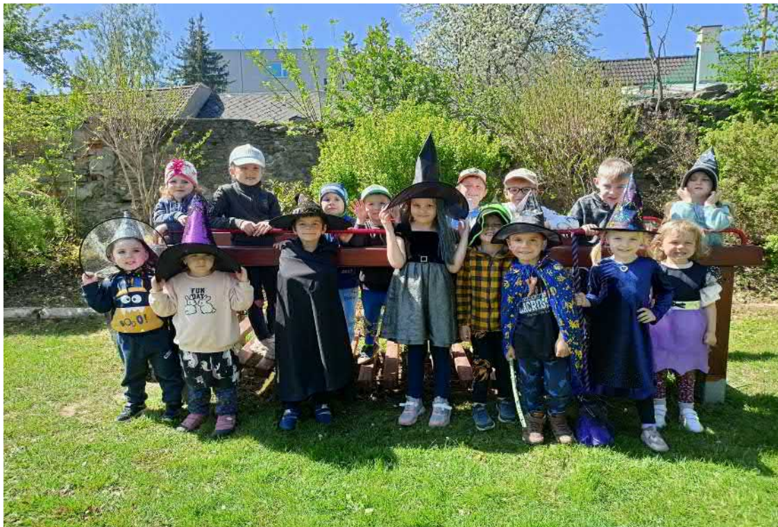
Hej, hej, hej, máme čarodějnický rej