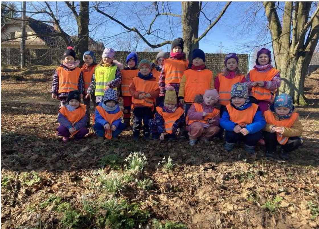
A jaro je tady