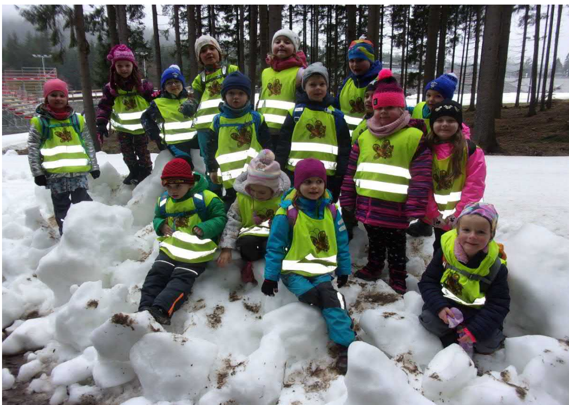
Výprava za tučňáky do Vysočina arény