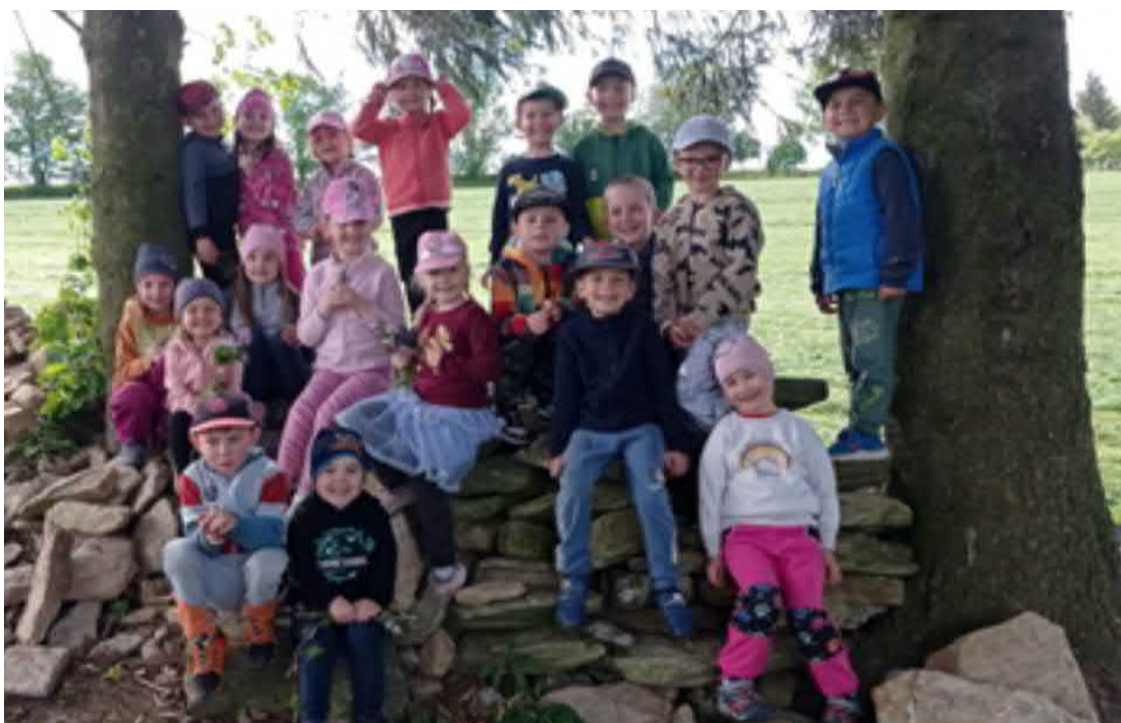
Vycházky do přírody a poznávání okolí města nás hodně baví