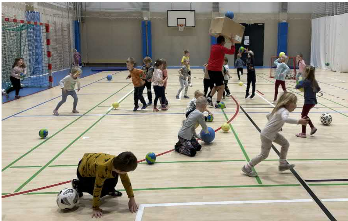
Cvičíme v hale s panem trenérem