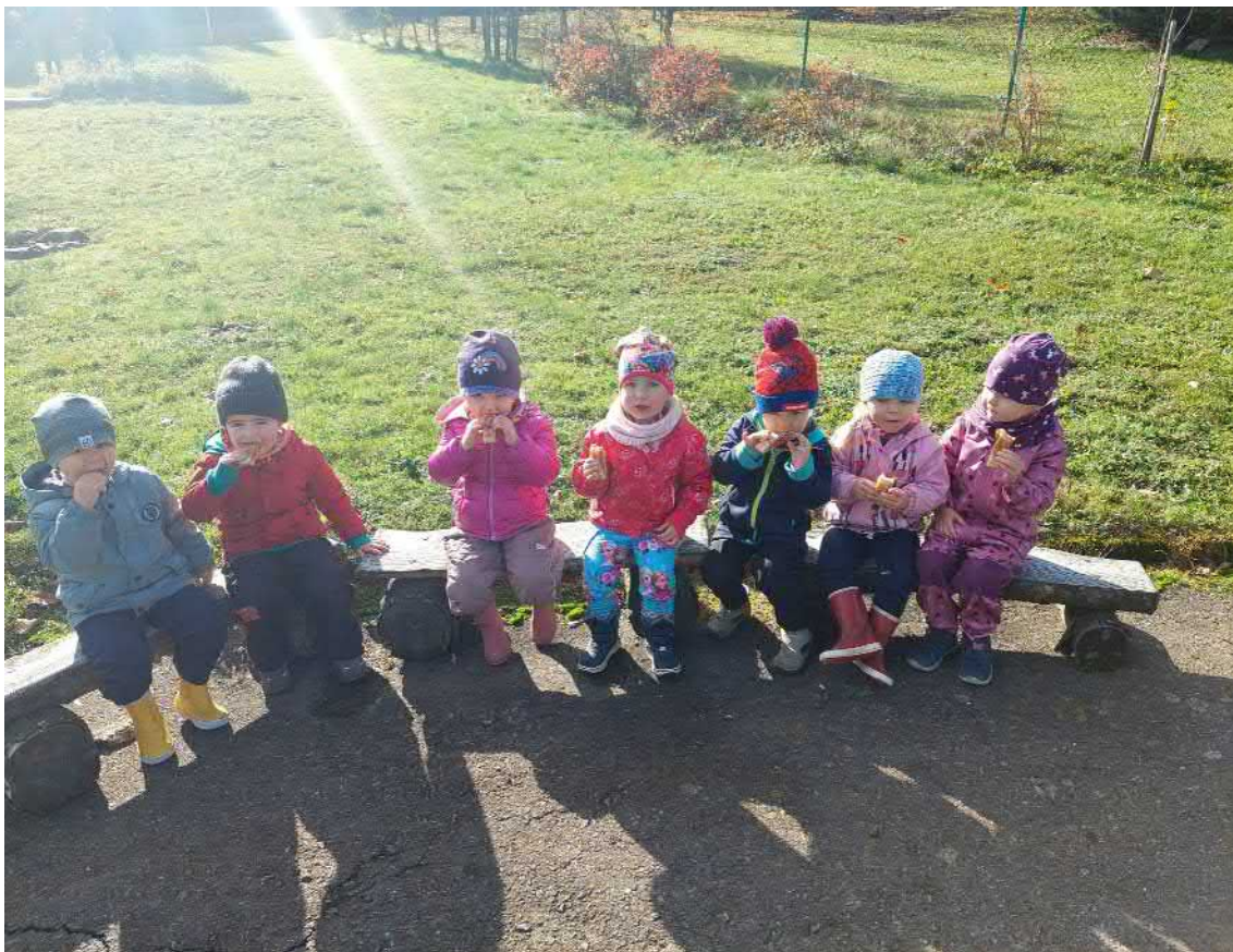
Společné pečení a poté ochutnávání štrúdlu