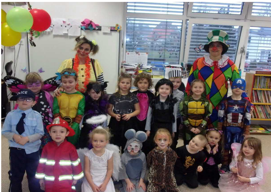
Karnevalové veselí s klauny