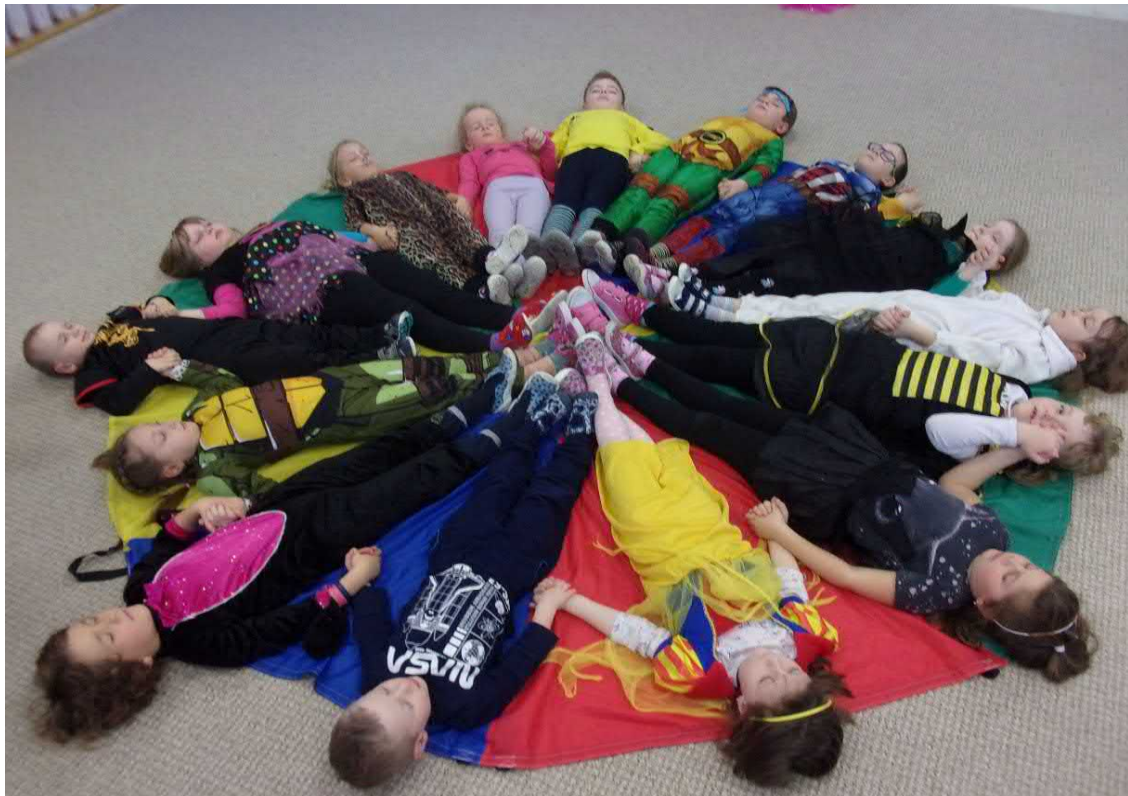
Relaxace na padáku mezi kamarády