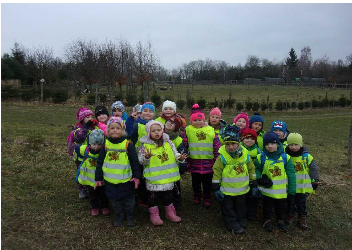
Výprava za zvířátky na Šaclovu farmu