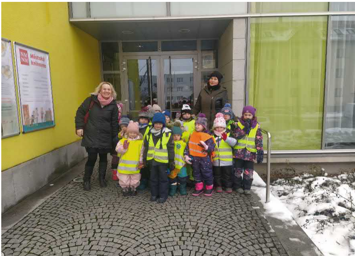
Cesta z kina. Děti se těšily na Velikonoce