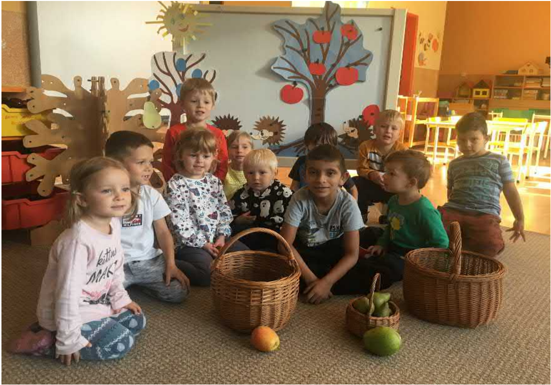
Podzimní sklízení ovoce