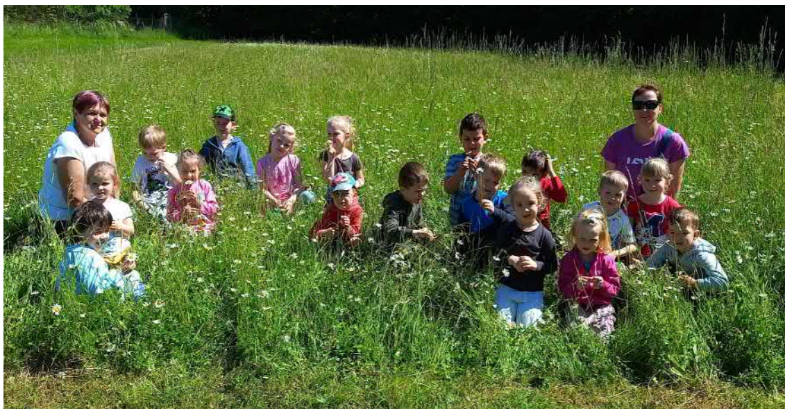
Léto v kopretinách