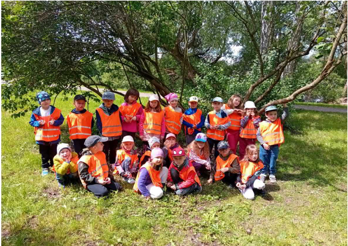
Na procházce u Cihelského rybníku