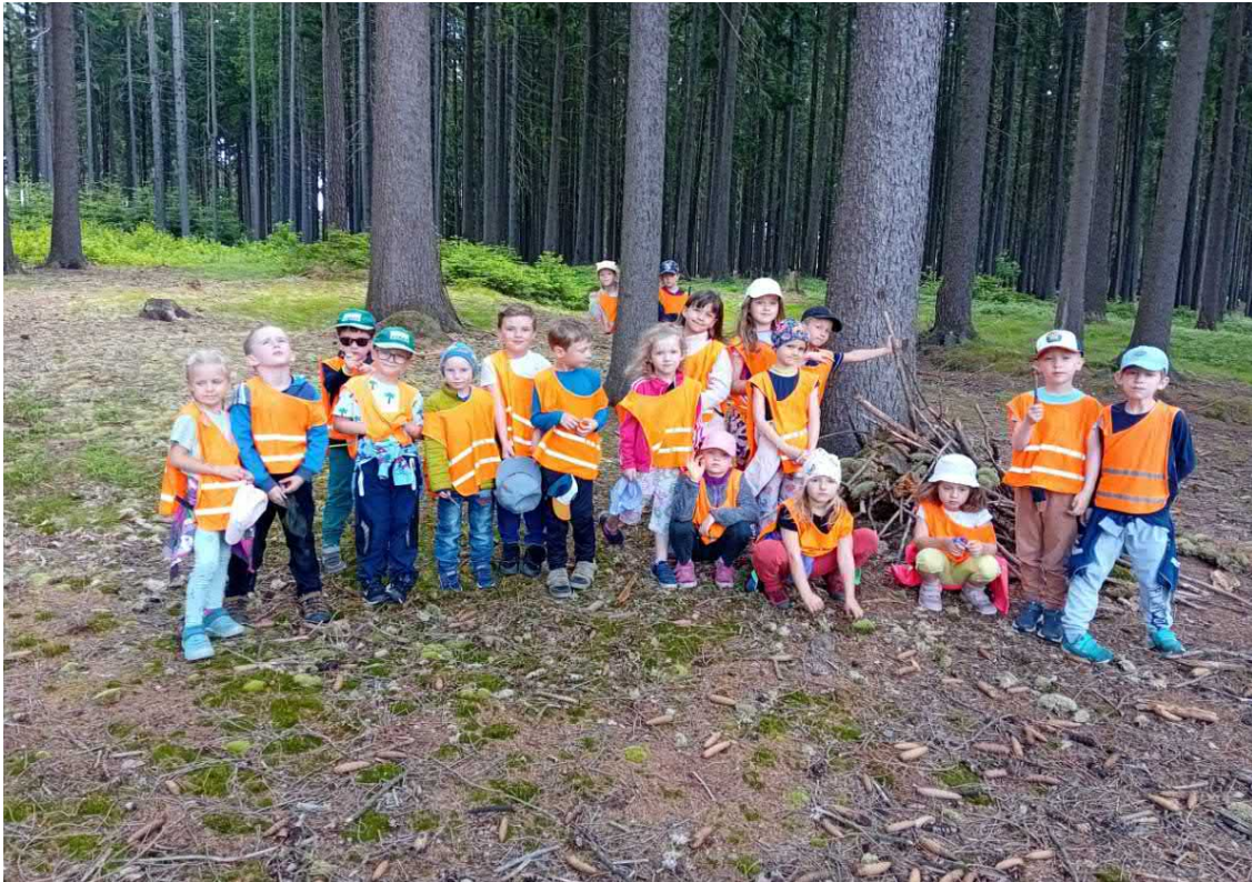
Hodně času jsme trávili v lese