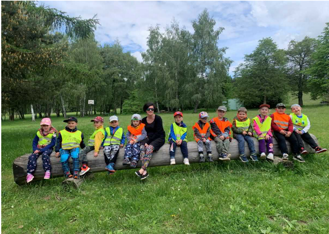
Jarní probouzení a zkoumání přírody