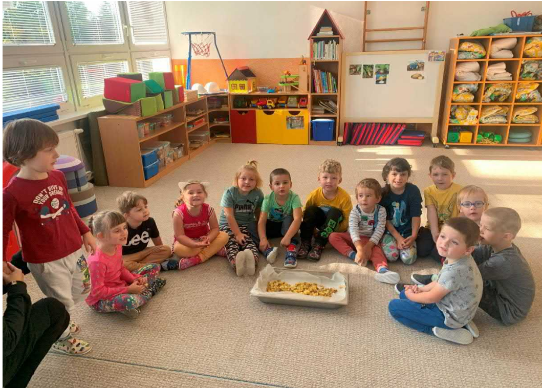
Pečení a ochutnávka brambor