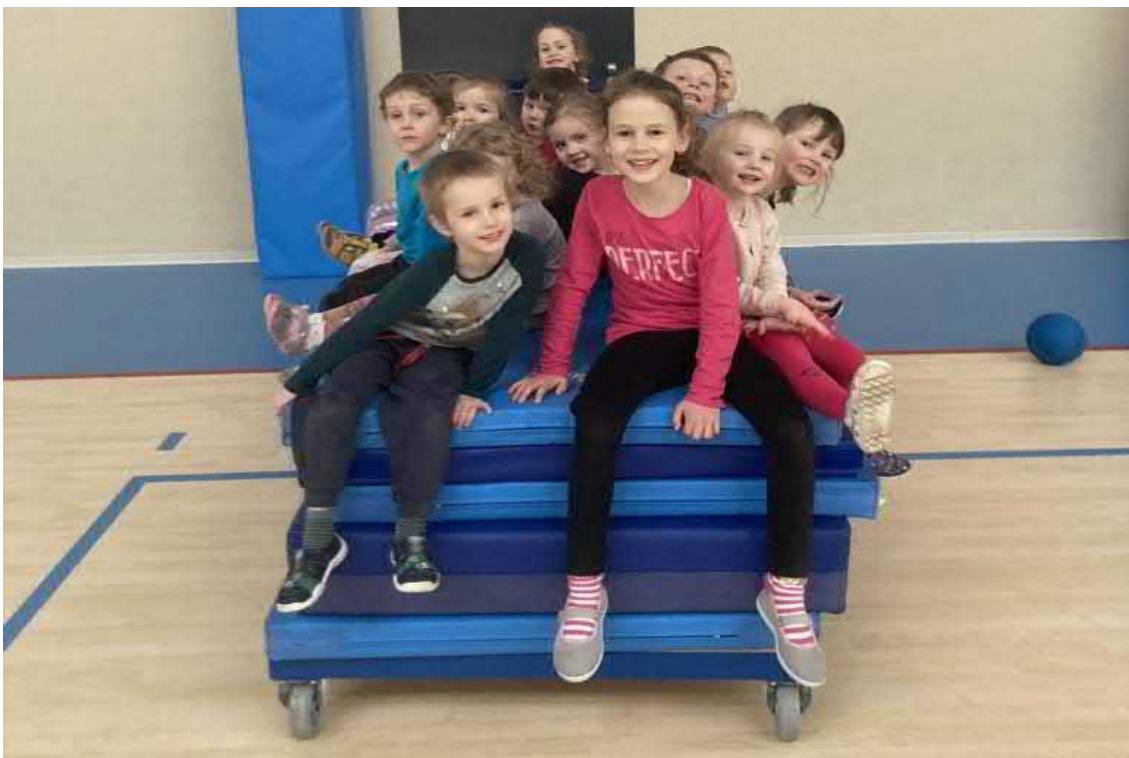
Ve sportovní hale se pořádně protáhneme