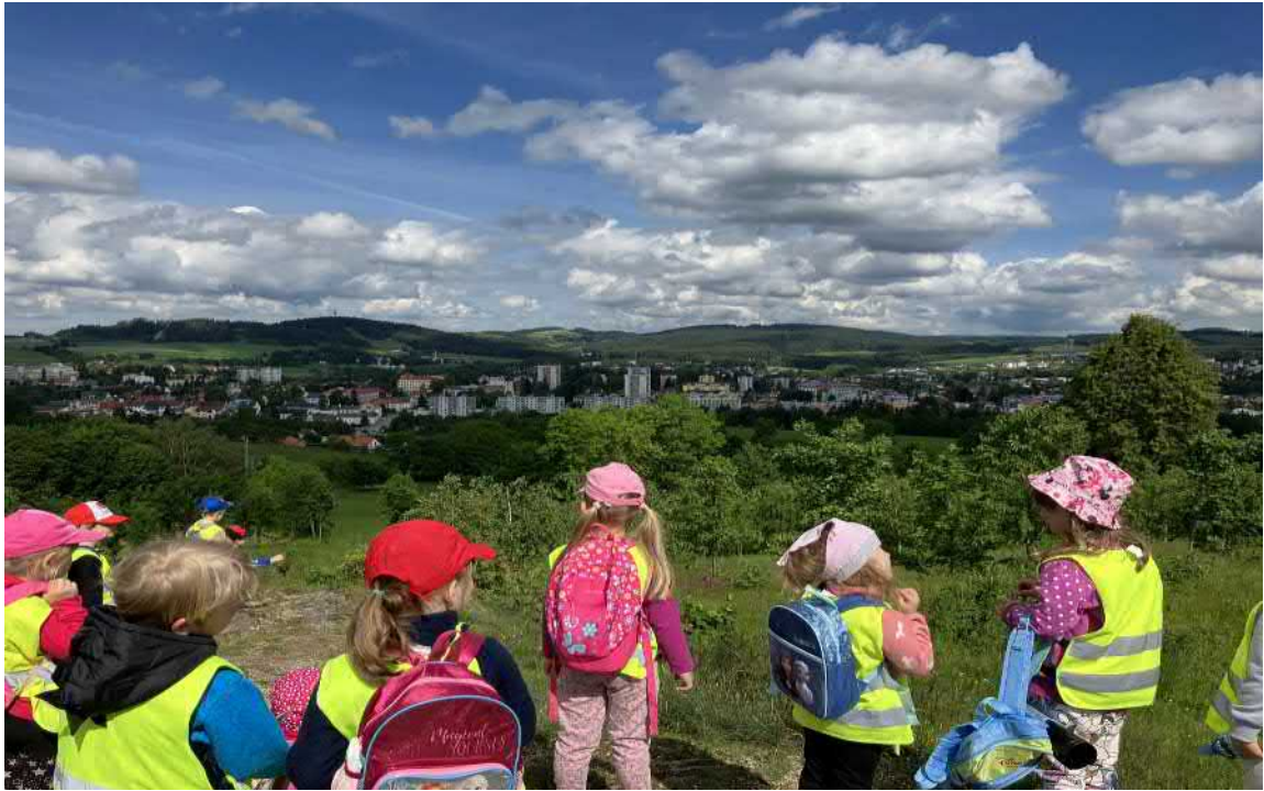
Výlet ke Třem křížům