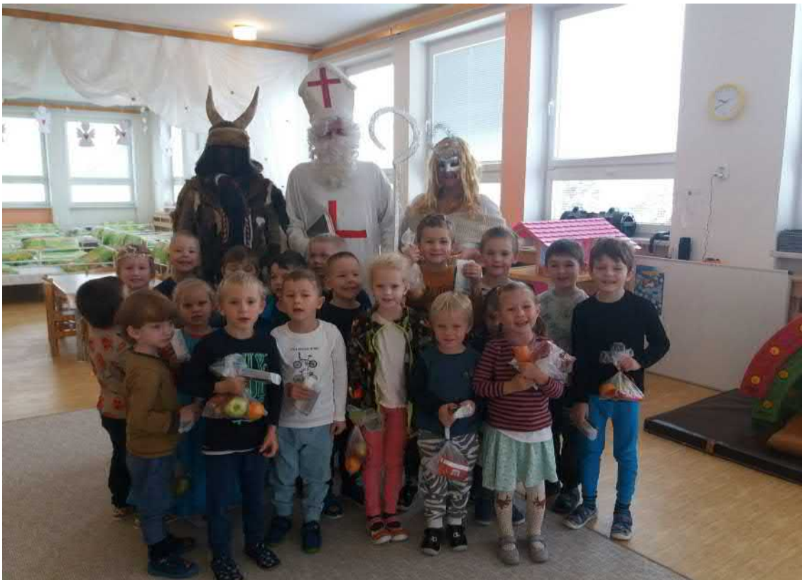
Mikuláš, čert a anděl