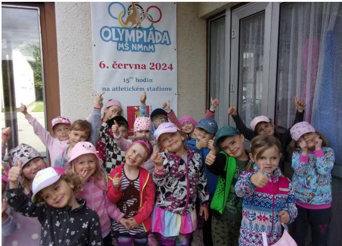
Těšíme se na olympiádu