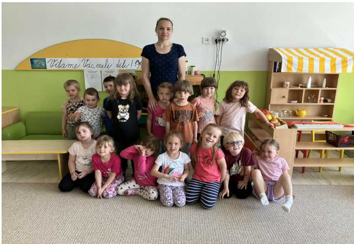
Záruka čistoty ve třídě