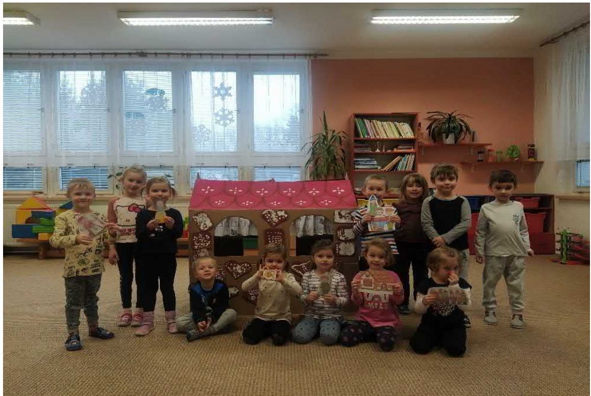
Pohádka O perníkové chaloupce