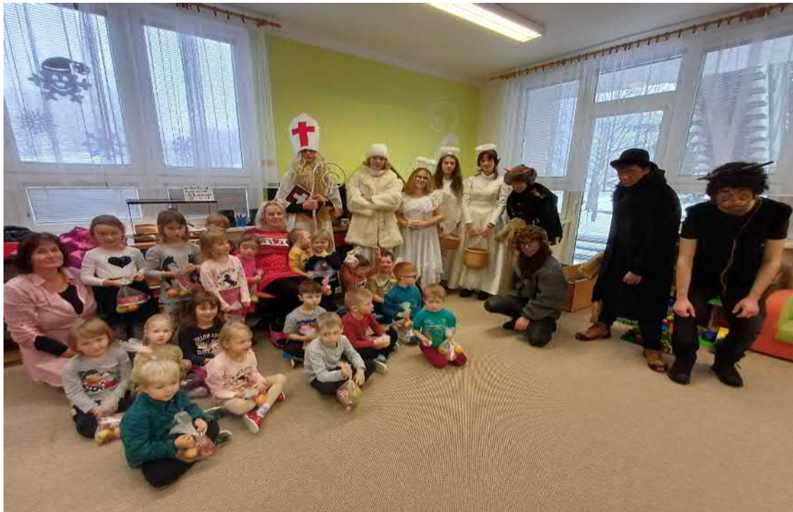
S čerty nejsou žerty