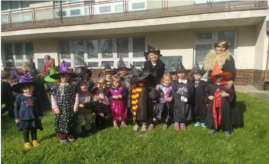
Čarodějnický rej na naší školkové zahradě