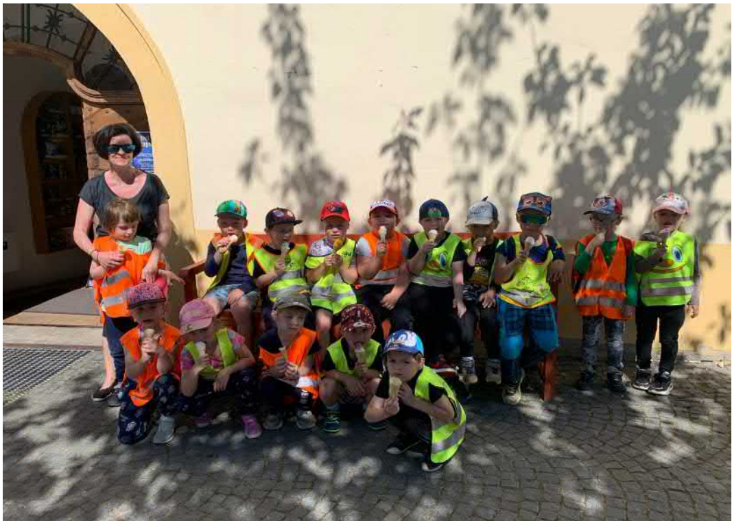
Den dětí slavíme dobrou zmrzlinou