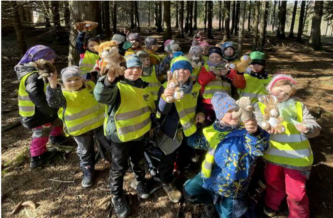
Objevujeme v přírodě