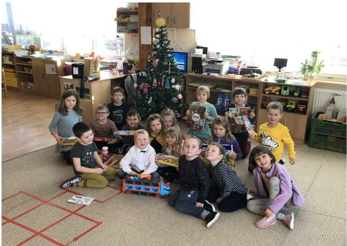
U vánočního stromečku s dárky