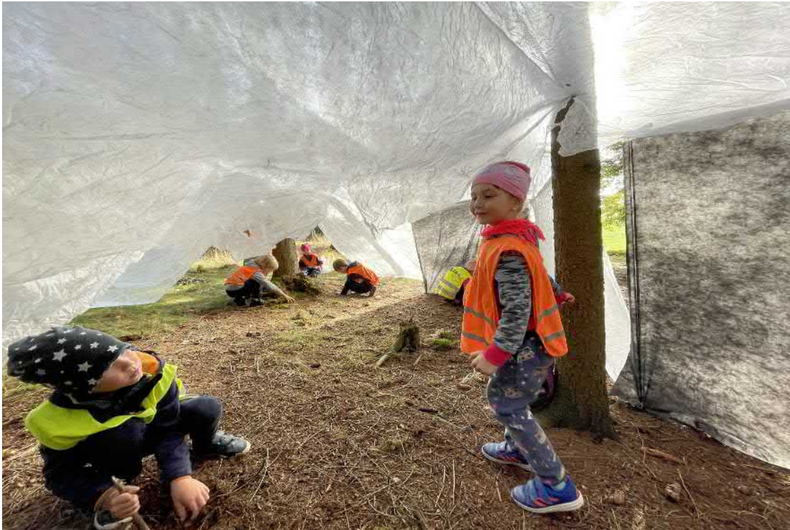
Naše skvělé domečky