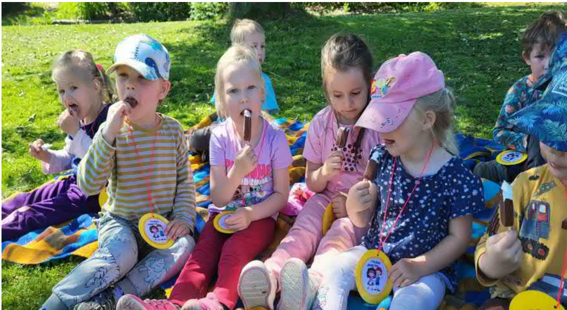
Nalezený poklad na Den dětí