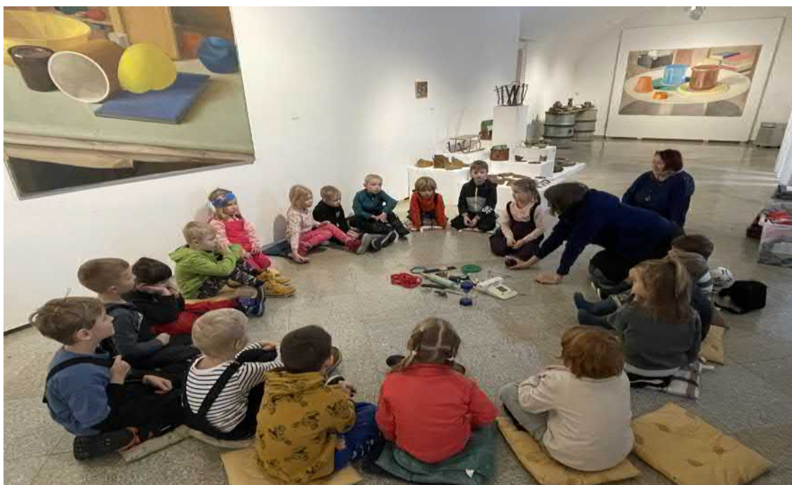
Malý galerista – pozorujeme, povídáme si, hrajeme si, tvoříme