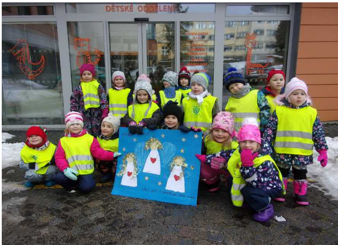
Rozdávání radosti na dětském oddělení v nemocnici