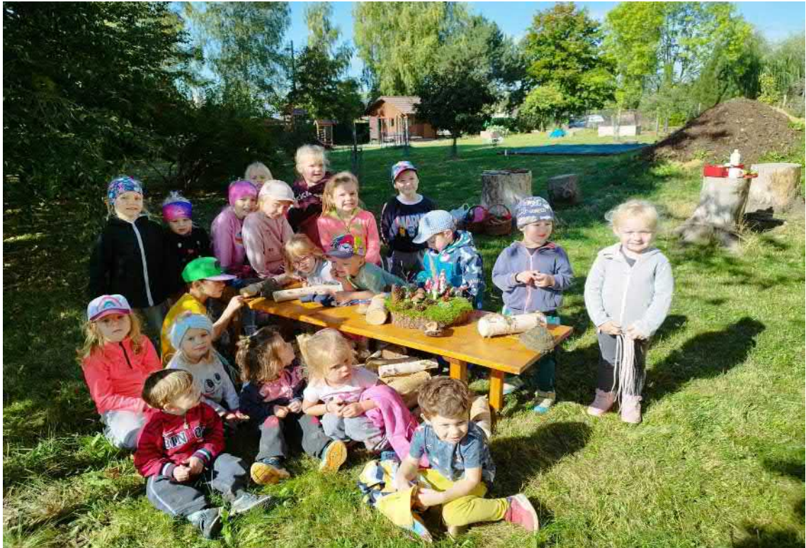
Podzimní tvoření „Skřítků podzimníčků“