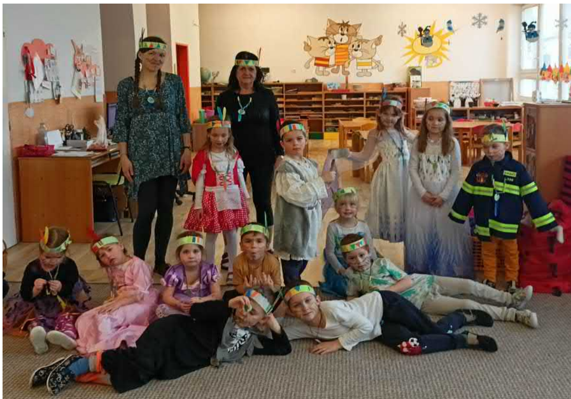
Hola, hej máme karnevalový rej