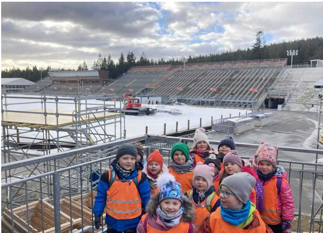
I my rádi sportujeme