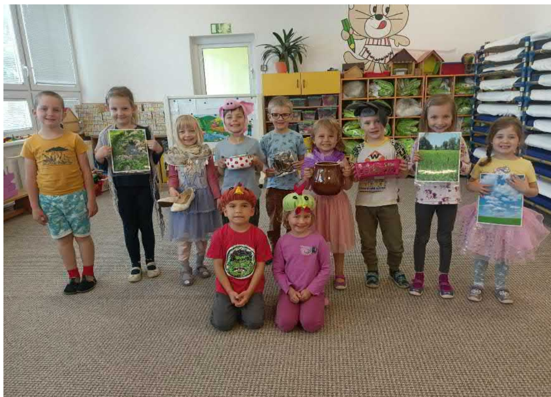
Zahráli jsme si pohádku O kohoutkovi a slepičce.