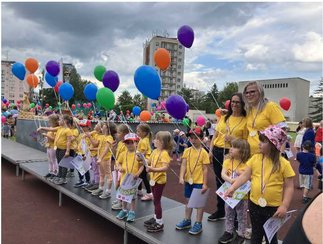
III. ročník Olympiády MŠ